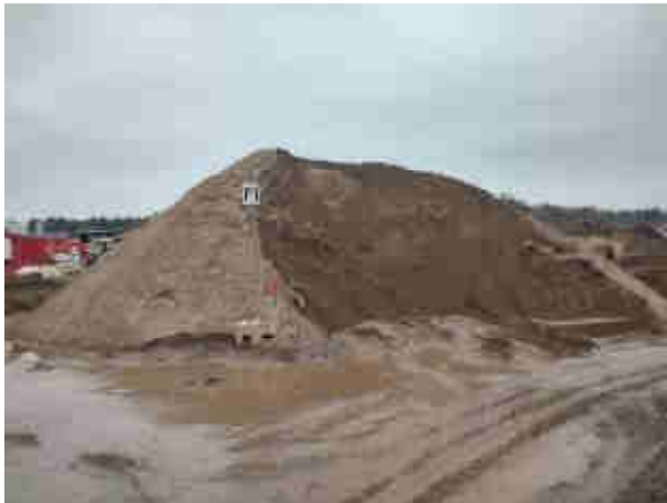
Abb. 3: Fa. Sand-Barthel, HW-P1, 23.11.2023