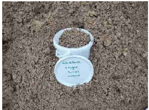
Abb. 6: Fa. Sand-Barthel, HW-P1/MP3, 23.11.2023