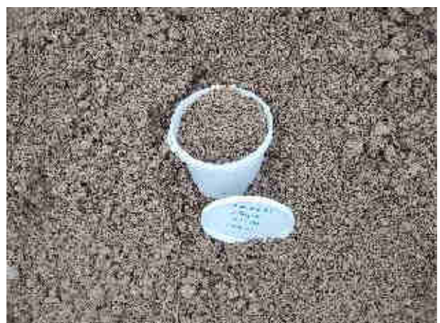
Abb. 8: Fa. Sand-Barthel, HW-P1/MP5, 23.11.2023