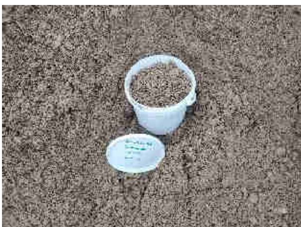
Abb. 7: Fa. Sand-Barthel, HW-P1/MP4, 23.11.2023