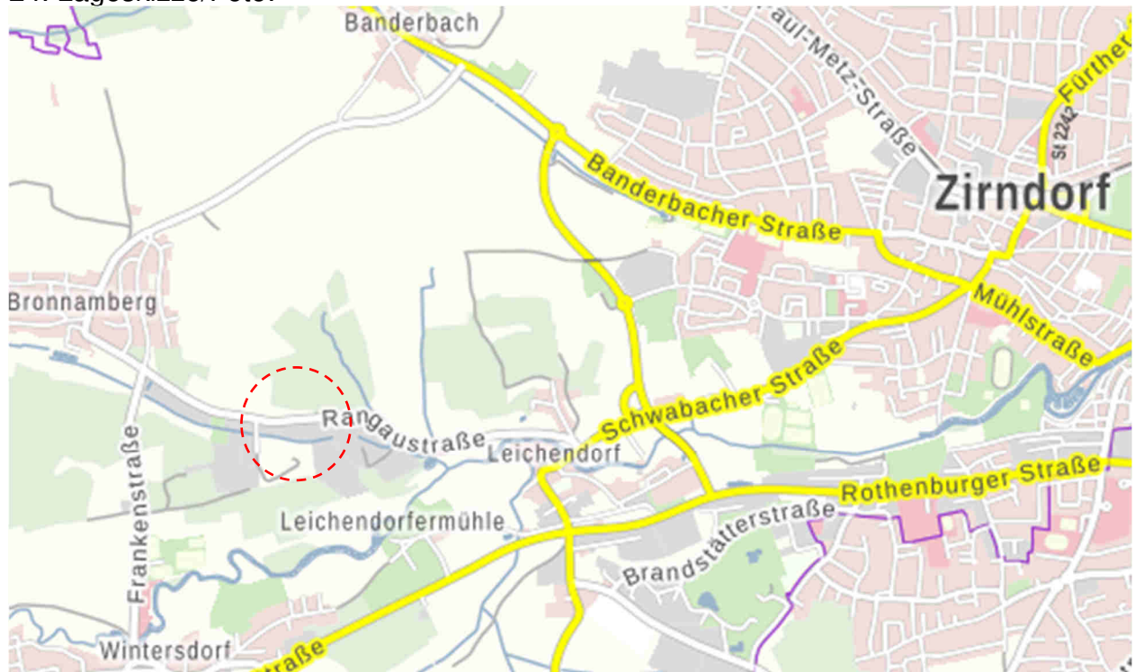
Abb. 1: Fa. Sand-Barthel, ca. Lage des ZL Rangastraße, 23.11.2023