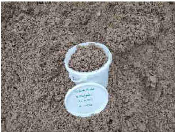
Abb. 5: Fa. Sand-Barthel, HW-P1/MP2, 23.11.2023