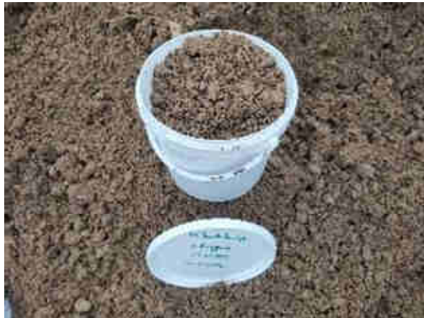
Abb. 9: Fa. Sand-Barthel, HW-P1/MP6, 23.11.2023