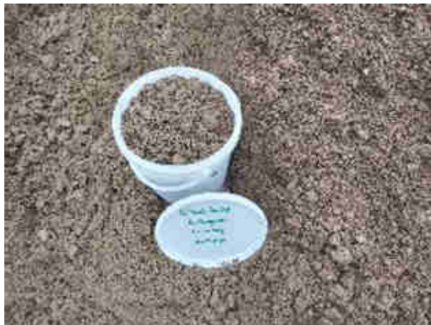
Abb. 11: Fa. Sand-Barthel, HW-P1/MP8, 23.11.2023