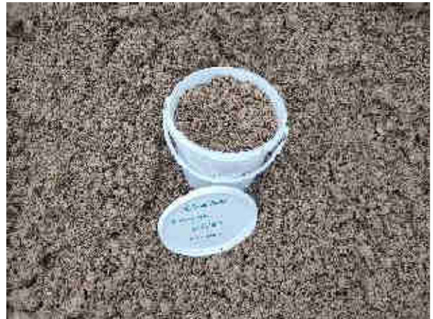
Abb. 4: Fa. Sand-Barthel, HW-P1/MP1, 23.11.2023